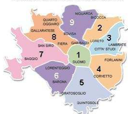
Zonazione del Comune di Milano

L'APERTURA È CONSENTITA DALLE ORE 7.00 ALLE ORE 22.00 PER NON PIÙ DI TREDICI ORE GIORNALIERE.