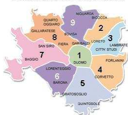
Zonazione del Comune di Milano

Riportiamo qui di seguito, una scheda riassuntiva del calendario, conseguente al combinato disposto delle norme di legge e della determinazione delle deroghe all'obbligo di chiusura domenicale e festiva degli esercizi di vendita ubicati nel Comune di Milano per l'anno 2009 ( Provvedimento PG 938236/2008 )