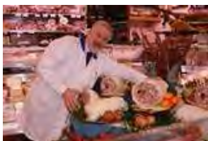
La Festa della Galantina 2010

E’ per noi motivo di orgoglio presentare queste prelibatezze alimentari e invitiamo tutti i nostri Soci a segnalarci le Loro iniziative, per poterle promuovere con le nostre News