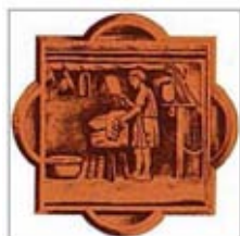
Gli Amici della Carne