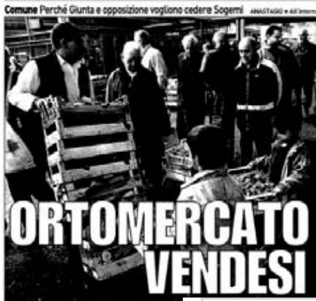
Comune Perché Giunta e opposizione vogliono cedere Sogemi ANASTASIO • ALL'INTERNO